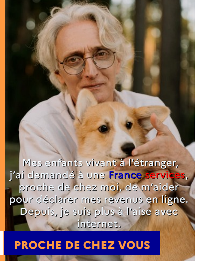
Laurent et Tyco - Théméricourt

Mes enfants vivant à l'étranger, j'ai demandé à une France services , proche de chez moi, de m'aider pour déclarer mes revenus en ligne. Depuis, je suis plus à l'aise avec internet.